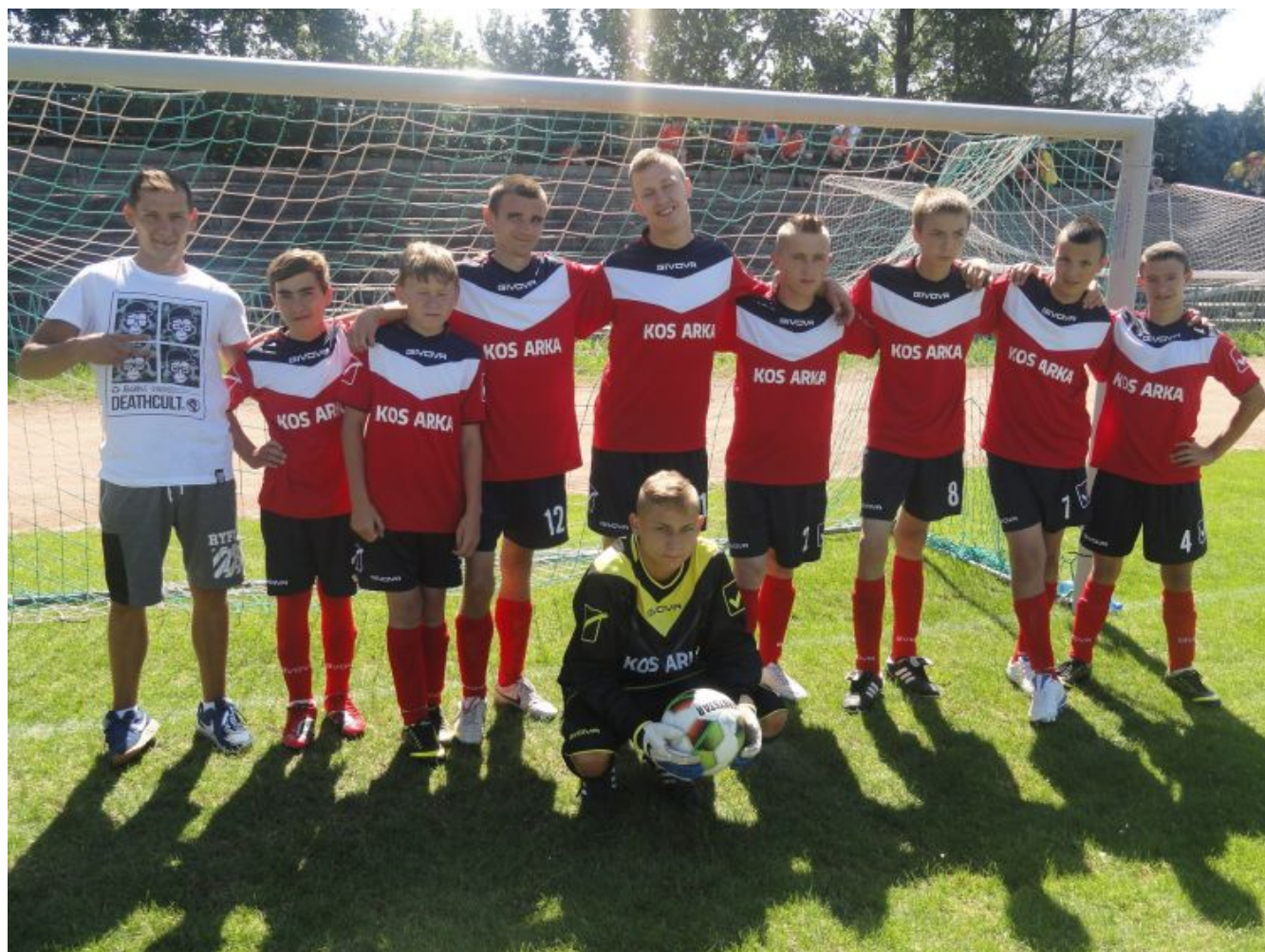
Swietokrzyski Turniej Pilki Noznej Olimpiad Specjalnych w Starachowicach